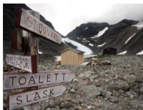
Det viktigaste. Turisterna efterfrågar ofta stugvärden, toan och var de kan kasta soporna, som källsorteras.